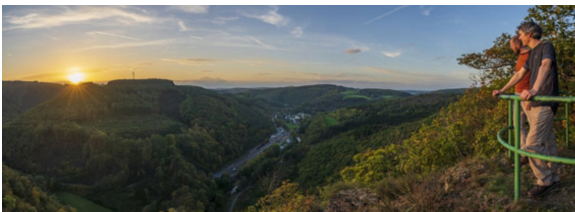
Lee Trail Luxemburg