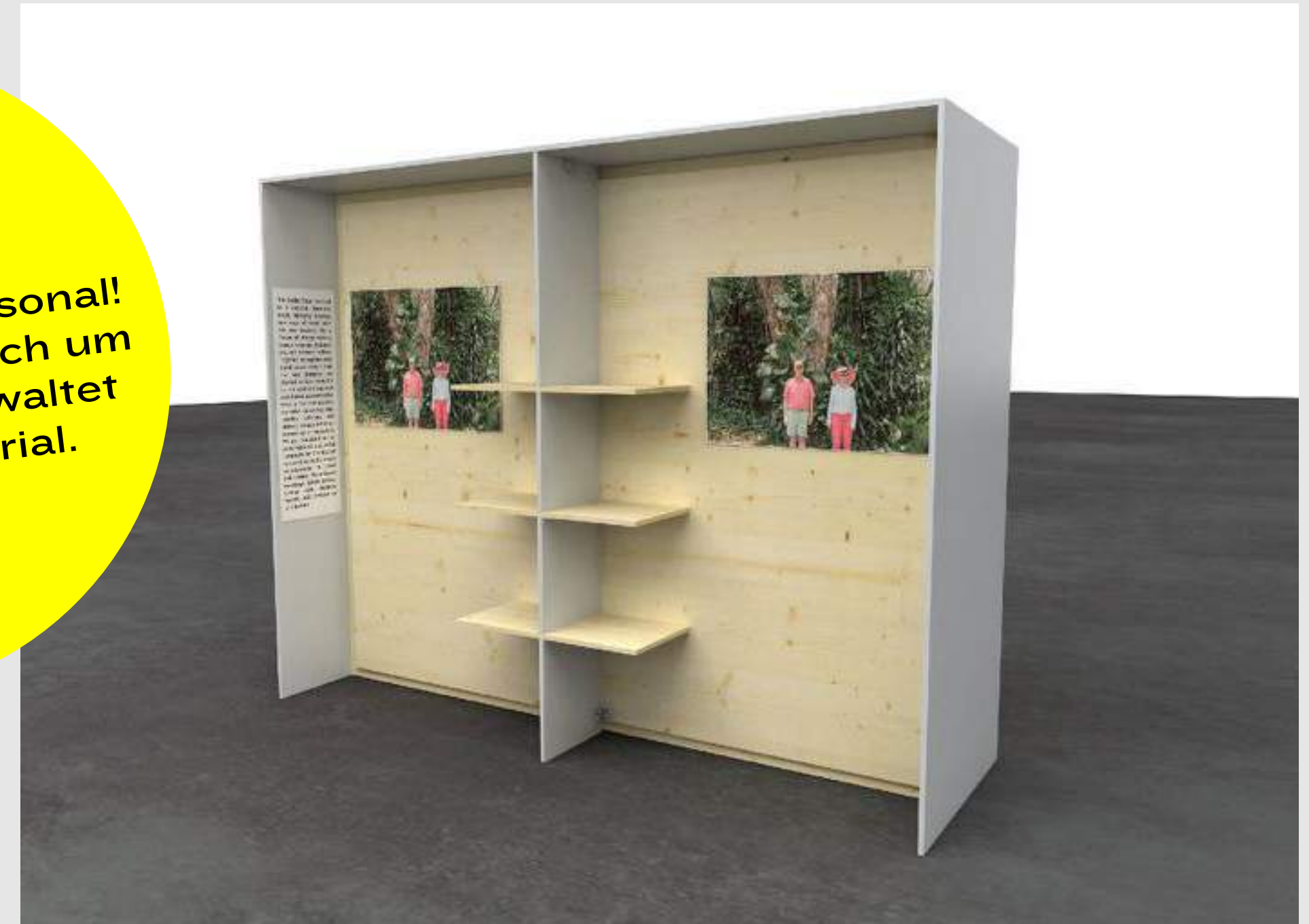
Diese Bilder sind nur visuelle Beispiele und können bei der Veranstaltung abweichen.

Spart das Messepersonal! Ein Host kümmert sich um die Fläche und verwaltet euer Werbematerial.